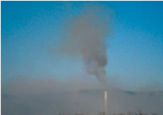
Industrijska su postrojenja ipak velik onečišćivač