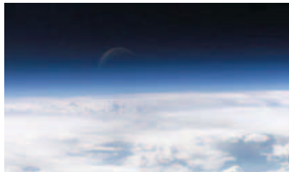
Zemljina atmosfera snimljena iz svemira

Onečišćenje zraka jedna je od glavnih briga građana Europske Unije i prema anketama čak 72 % smatra da institucije ne poduzimaju dovoljno mjera za poboljšanje zraka, a 87 % misli kako su respiratorne bolesti ozbiljan društveni problem. Štoviše to potvrđuje i činjenica da od loše kvalitete zraka na godinu umre gotovo pola milijuna ljudi. Zagađenje zraka glavni je uzrok plućnih bolesti, poput astme, koja je danas dva puta raširenija nego prije 30 godina te uzrokuje više od 350 tisuća preranih smrti u Europskoj Uniji svake godine. Europska komisija stoga priprema novu strategiju za poboljšanje kvalitete zraka u Europi. Već je uspostavljena suradnja sa Svjetskom zdravstvenom organizacijom radi razmatranja najnovijih znanstvenih podataka o najvećim zagađivačima zraka, ali i informiranja javnosti o posljedicama zagađenja za zdravlje ljudi. Komisija je organizirala i javne konzultacije o tome kako bi se moglo poboljšati kvalitetu zraka u Europi koje će trajati do 4. travnja, a svoje mišljenje već je izrazilo 25.000 europskih građana.