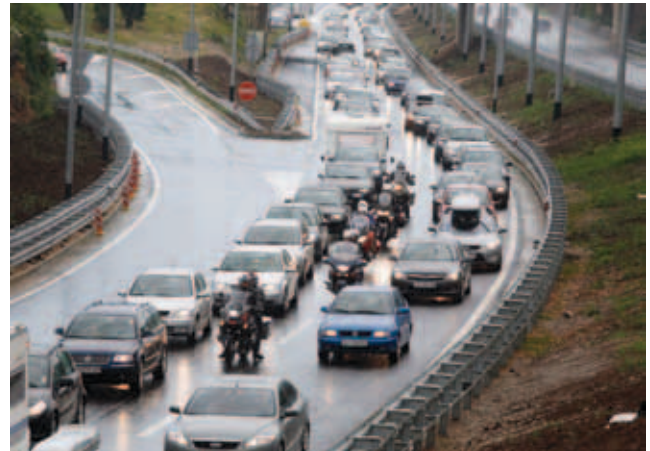
Vozila na fosilna goriva uzrokuju velika onečišćenja

Osim prirodnih uzroka onečišćenja, mnogi su posljedica ljudskih aktivnosti, a ističu se plinovi, lebdeće čestice, metali i metaloidi te postojeane organske i radioaktivne tvari