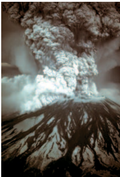
I prirodni izvori onečišćenja utječu na kvalitetu zraka: eksplozija jednog vulkana u Tihom oceanu

Valja međutim istaknuti da unatoč drugačijim predodžbama i prirodni izvori mogu biti veliki onečišćivači zraka, po-