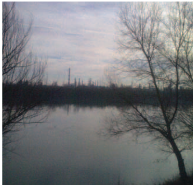
U Slavonskom Brodu zrak onečišćuje rafinerija u Bosanskom Brodu

kriterija je broj dopuštenih dana prekoračenja propisanih koncentracija. Tako je primjerice za čestice fine prašine (PM10) ustanovljeno onečišćenje ako je granična vrijednost prekoračena više od 35 puta u kalendarskoj godini, za sumporov dioksid ( \text{SO}_2 ) ako je granična vrijednost prekoračena više od 3 puta na godinu, za sumporovodik ( \text{H}_2\text{S} ) ako je prekoračena više od 7 puta tijekom godine, za ozon ( \text{O}_3 ) ako je ciljna vrijednost prekoračena više od 25 puta u godini itd.