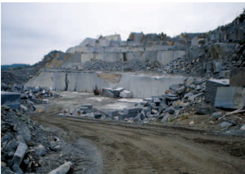
Kamenolomi mogu biti izvor onečišćenja

Prema vrsti onečišćenja može se sistematizirati velik broj grupa, ali se najčešće uzima agregatno stanje u kojem izvor emitira onečišćujuće tvari, dakle izvori plinova i čestica te zajednički izvori plinova i čestica koji mogu biti trajni i povremeni.