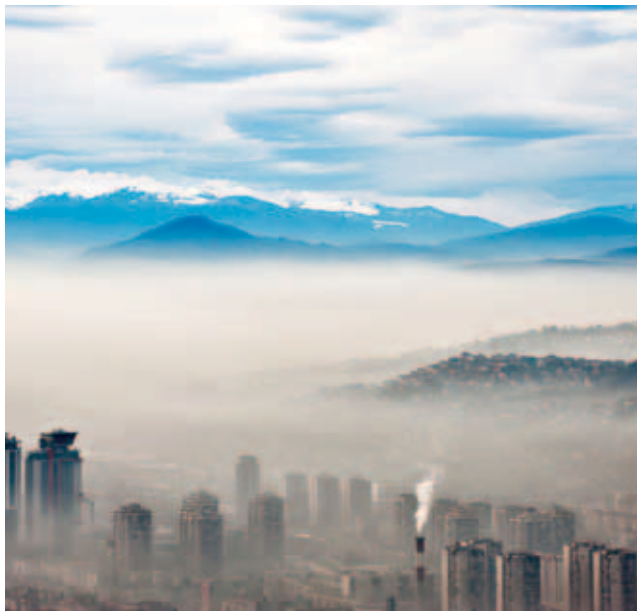
U našoj okolini najviše problema s čistoćom zraka ima Sarajevo